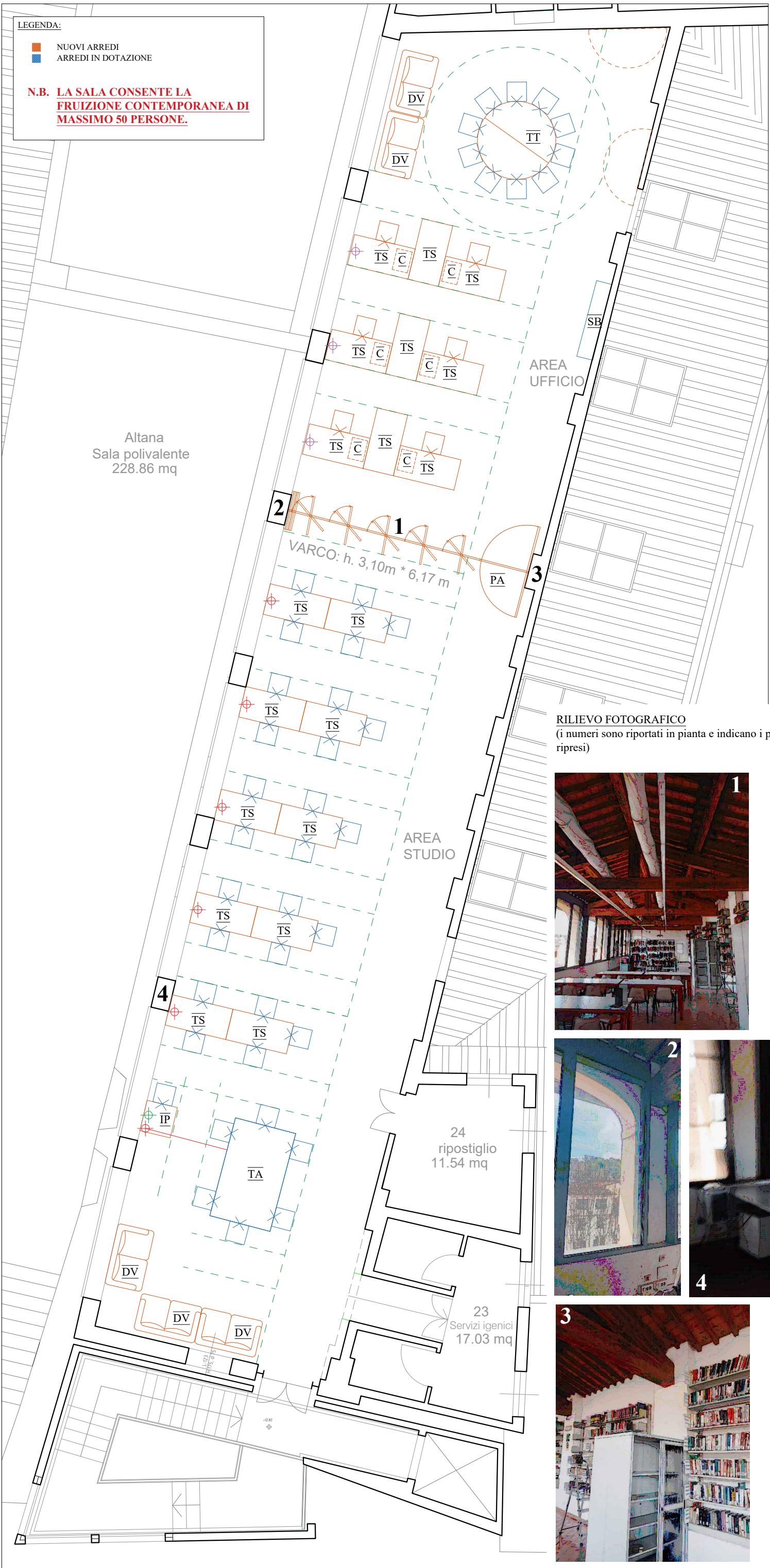
RILIEVO FOTOGRAFICO (i numeri sono riportati in pianta e indicano i punti ripresi)

N.B. LA SALA CONSENTE LA FRUIZIONE CONTEMPORANEA DI MASSIMO 50 PERSONE.