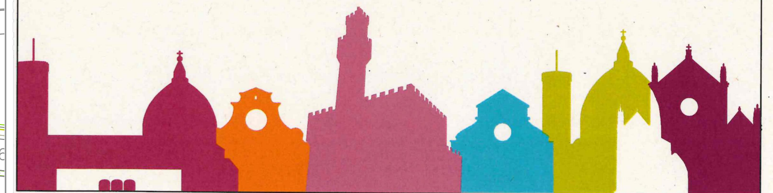
Tavola 02 - Stato di Progetto

Progettisti: Ing. Lucia Trevisani Lucia Trevisani Add. Tec. Alessandro Communi Alessandro Communi