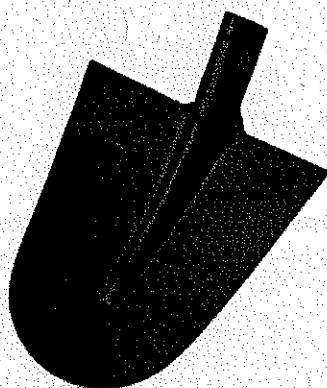
Vanga Professionale tipologia "Ortolano"