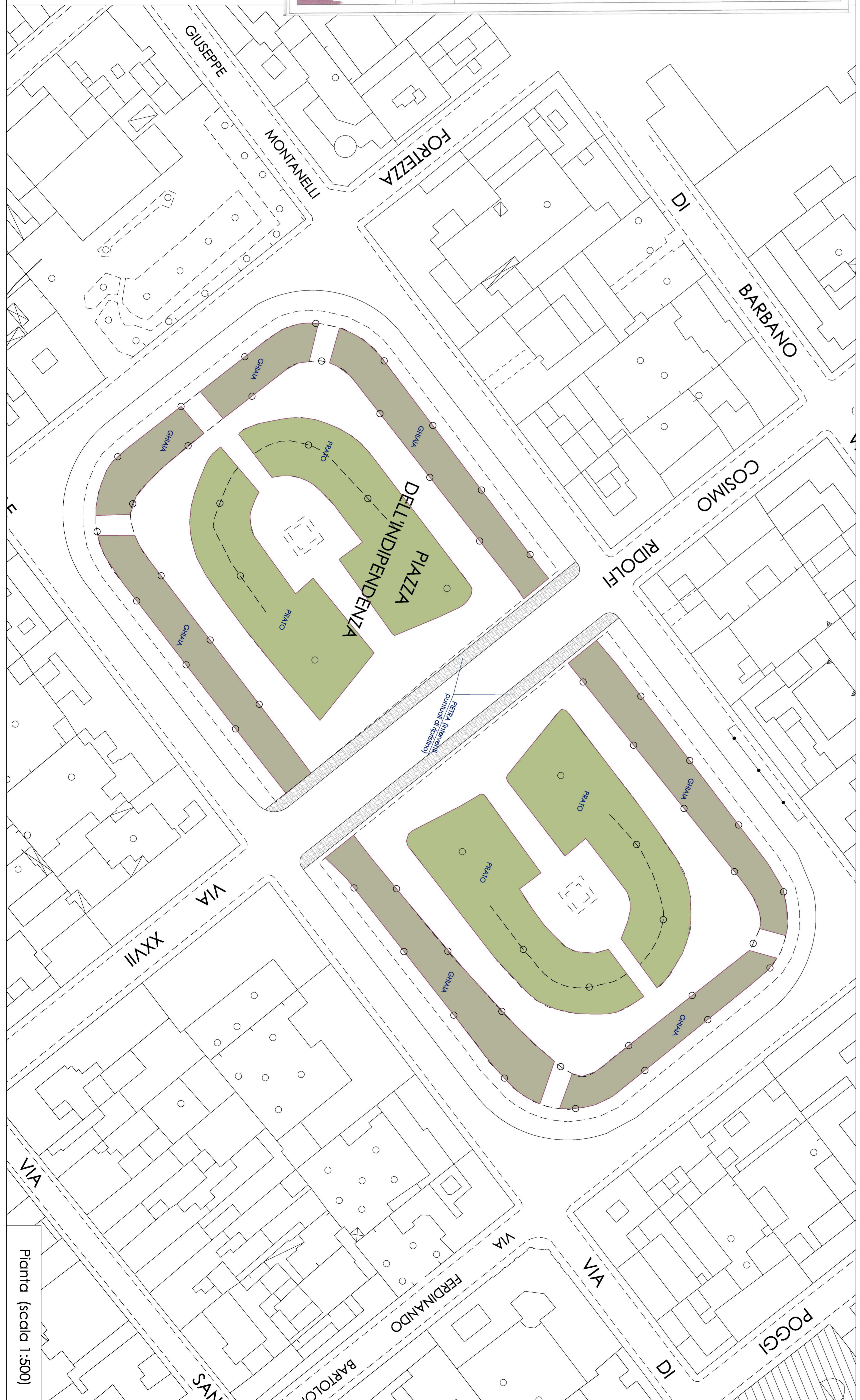
Pianta (scala 1:500)