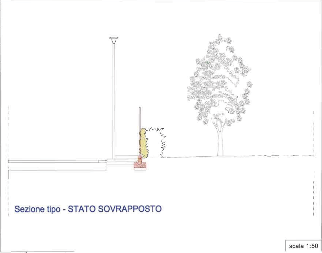
Sezione tipo - STATO SOVRAPPOSTO