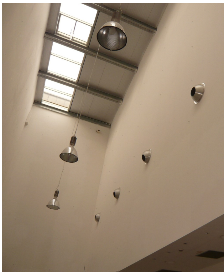
Auditorium Ex3 – Interno – Illuminazione atrio ingresso