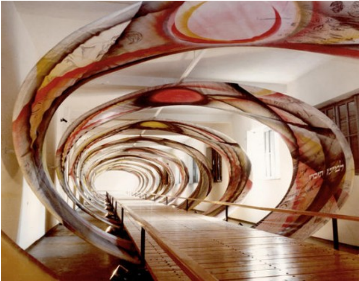
Memoriale di Auschwitz