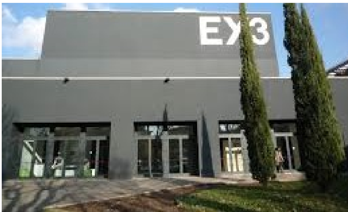
Auditorium Ex3 – Ingresso da Viale Giannotti