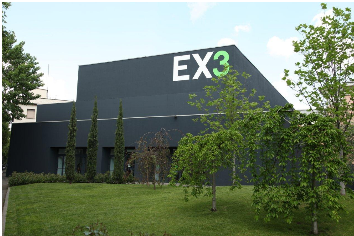
Auditorium Ex3 – Vista da Viale Giannotti