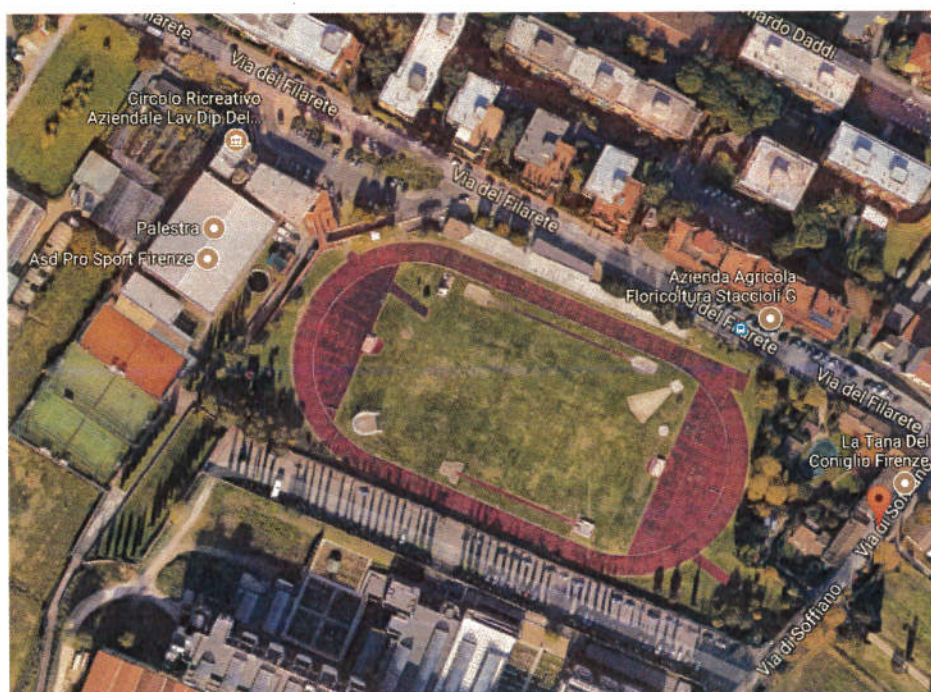
Veduta generale area di intervento

L'Impianto Sportivo polivalente Betti-Soffiano, posto in Via del Filarete n.c. 5/A, località Soffiano è stato realizzato nell'anno 2000. E' costituito da una palestra, utilizzata per il basket e la pallavolo, da due campi da calcetto in erba sintetica ed uno da tennis, oltre ad una piccola tribuna scoperta, una pista di atletica a 6 corsie con due pedane per il salto in lungo/triplo, due pedane per il lancio del giavellotto, una pedana per il getto del peso, una pedana per il salto con l'asta e la gabbia per i lanci del disco e del martello. E' presente una tribuna scoperta situata lungo il rettilineo d'arrivo. Inoltre sono presenti una palazzina bar, uffici e spogliatoi.