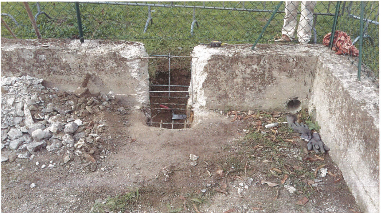
Particolare dei saggi cordolo laterale e platea