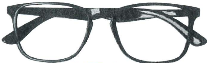
Mod. BEST colore nero