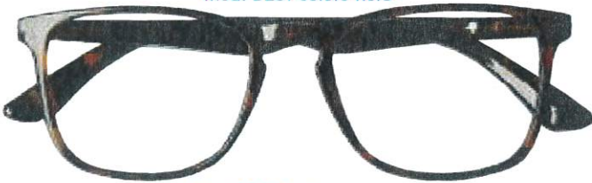
Mod. BEST colore tartaruga