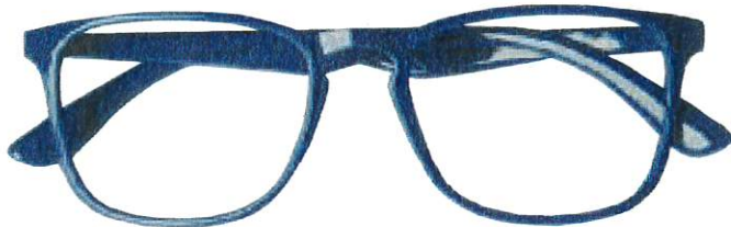
Mod. BEST colore blu