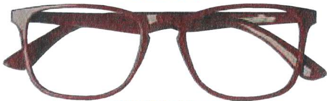
Mod. BEST colore rosso