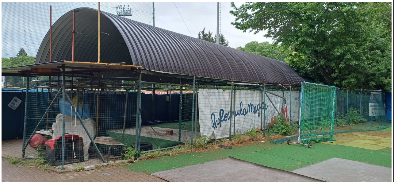
Tunnel allenamento baseball