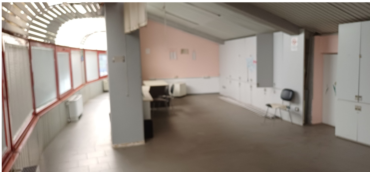
Locali ex uffici comunali al piano primo del sottotribuna