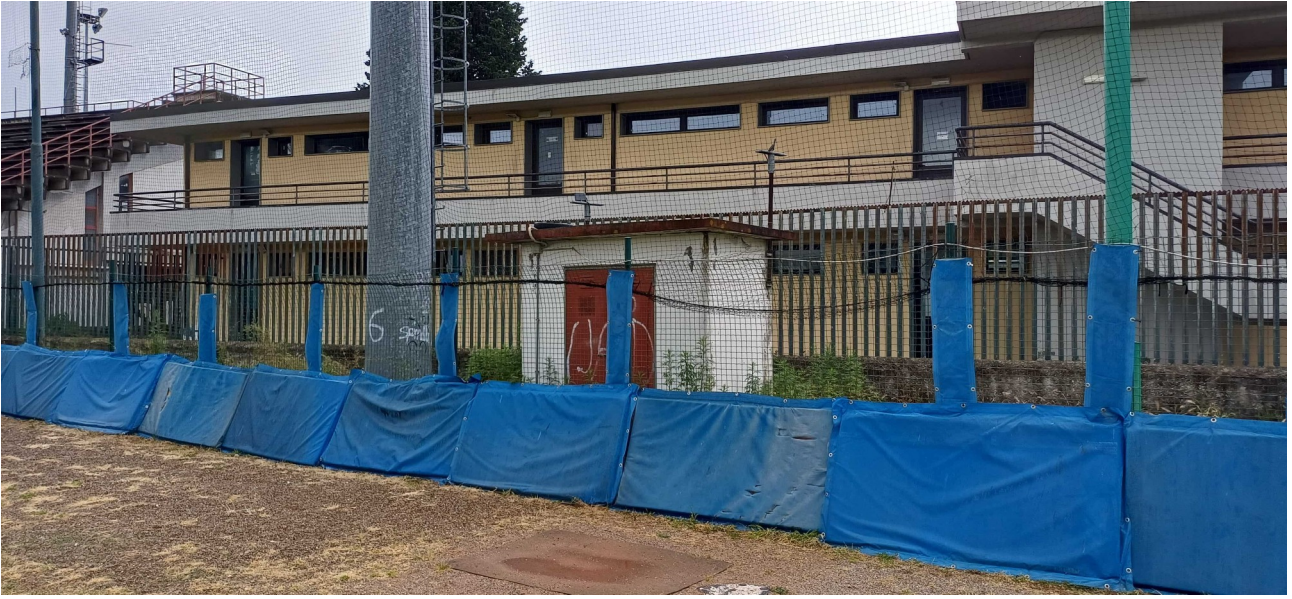
Palazzina spogliatoi calcio