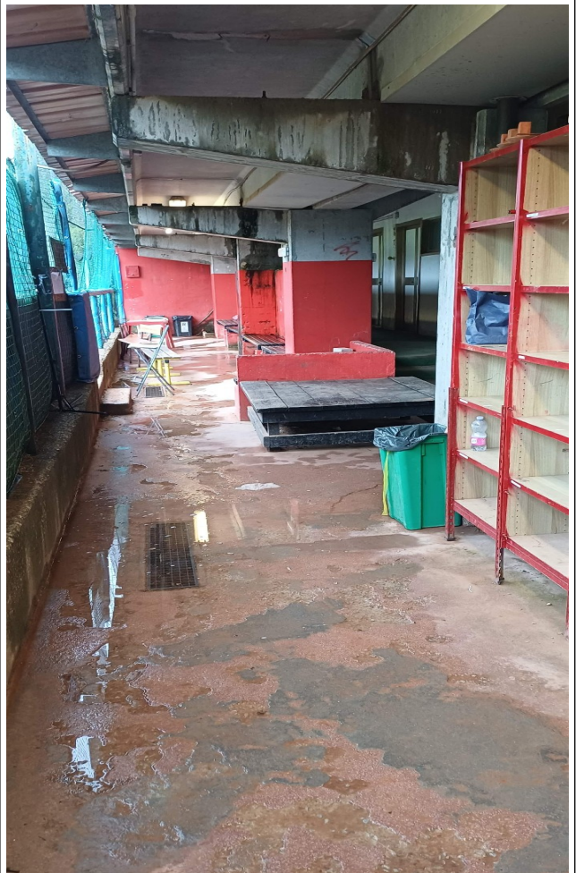
Camminamento pedonale tra campo baseball e spogliatoi