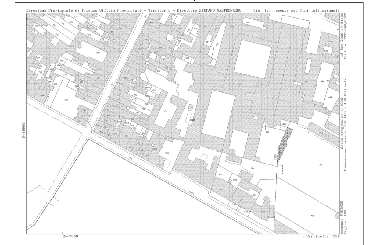
estratto di mappa catastale