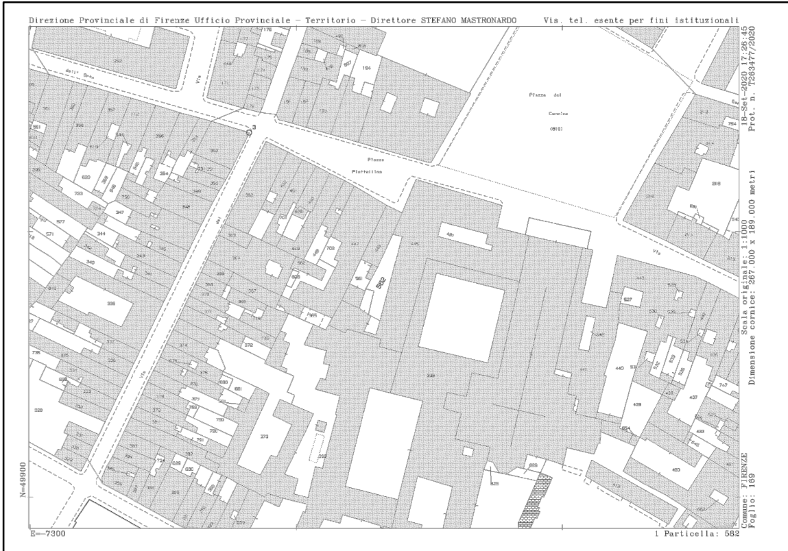
estratto di mappa catastale